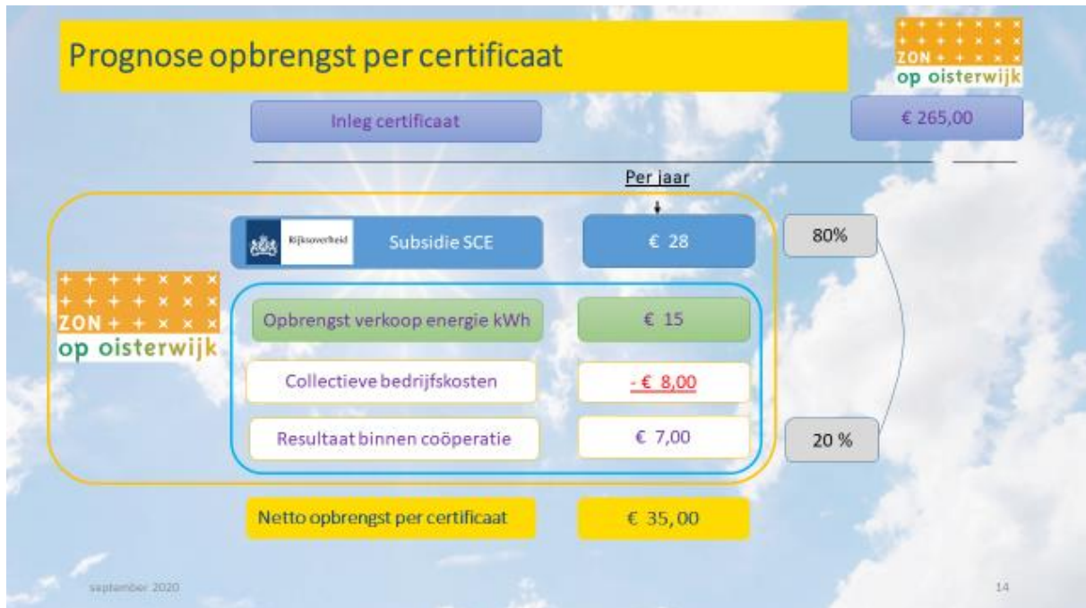
Overzicht netto-opbrengst per certificaat

Daarmee is duurzame energie niet alleen schoon, het is ook nog eens winstgevend.